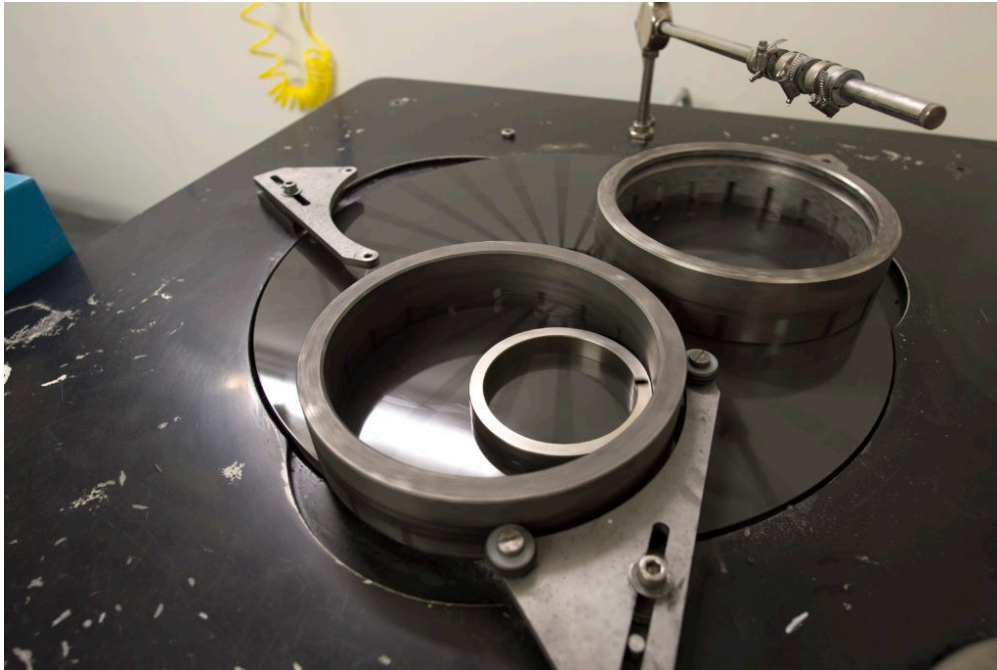
Exemple de contrôle optique